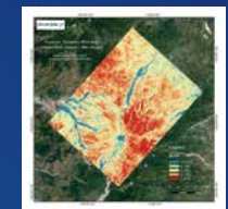
DIWATA-1に搭載されたマルチスペクトルイメージャー(SMI)によって撮影されたフィリピン・ルソン島ピナツボ火山の火口付近の植生指数