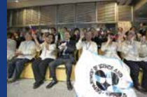
DIWATA-1放出を見学する関係者