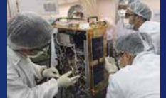
DIWATA-1を組み立てるフィリピンからの留学生